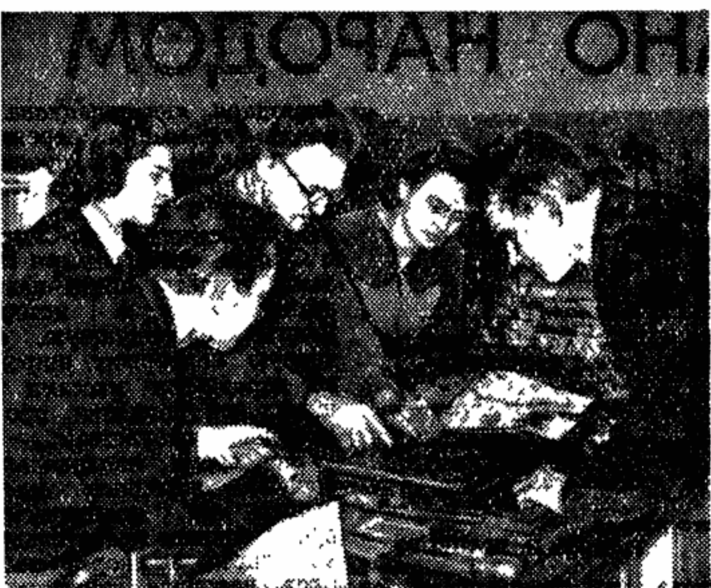
«ЖУРНАЛИСТ» Так называется учебная газета, которая начала выходить на факультете журналистики Московского государственного университета имени М. В. Ломоносова. Газета является школой для будущих журналистов.